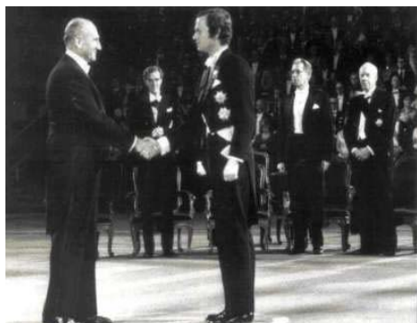
Vladimir Prelog preuzima Nobelovu nagradu od švedskog kralja Gustava (1975.)