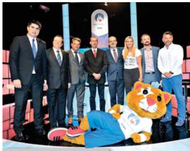
Potpisivanje sporazuma s HRT-om