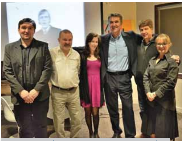
Organizatori i izvođači programa večeri posvećene Arsenu Dediću

Već 12. veljače u prepunom trendnom Baka Café-u u Bloor West Village-u u Torontu AMCA je u prisustvu gospođe Matković priredila nezaboravnu multimedijalnu kulturno-glazbenu večer posvećenu hrvatskom glazbenom doajenu, Arsenu Dediću.