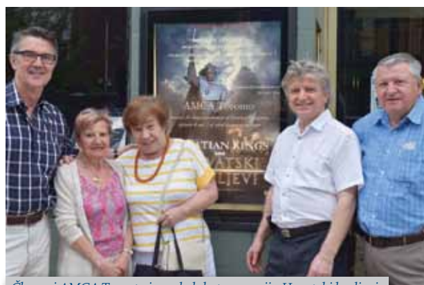
Članovi AMCA Toronto ispred plakata za seriju Hrvatski kraljevi

Od novih aktivnosti svakako je važno spomenuti sjeverno-američku premijeru najvećeg projekta HRT-a, dokumentarno igranu seriju Hrvatski kraljevi. Prvu epizodu serije AMCA Toronto je prezentirala u kulturnom povijesnom kinu Revue Cinema na Roncesvalles Avenue u Torontu. Premijera je bila vrlo dobro posjećena, a nakon projekcije, uz čašu vina i hors d'oeuvres, posjetitelji su razmijenili dojmove o filmu. Organizirane su i večeri dobrodošlice novoj veleposlanici Republike Hrvatske u Ottawi, i novoj gostujućoj profesorici hrvatskih studija na University of Toronto.