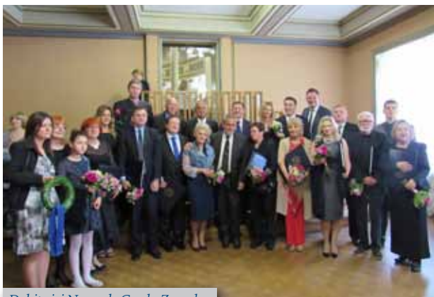
Dobitnici Nagrade Grada Zagreba