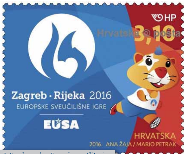
Poštanska marka - Europske sveučilišne igre

Europske sveučilišne igre dosad su održane dva puta, 2012. u Cordobi i 2014. u Rotterdamu, a nositelj im je Europska sveučilišna sportska organizacija (EUSA), dok su Europske sveučilišne igre Zagreb - Rijeka 2016. organizirane pod vodstvom Hrvatskoga akademskog sportskog saveza (HASS), uz partnerstvo Ministarstva znanosti, obrazovanja i sporta, gradova Zagreba i Rijeke te sveučilišta u Zagrebu i Rijeci.