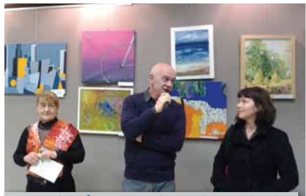
Otvorenje izložbe „Španciramo Zagrebom“ u Galeriji specijalne policije

Likovna sekcija imala je samostalnu izložbu u knjižnici Augusta Cesarca. U Galeriji AMACIZ-a u zadnjih godinu dana održane su tri izložbe, a kao svake godine postavili su i izložbu uz Skupštinu AMACIZ-a 18. ožujka. Osnovana je i Keramička sekcija, gdje članice izrađuju prekrasne keramičke posude, vaze i druge ukrasne predmete.