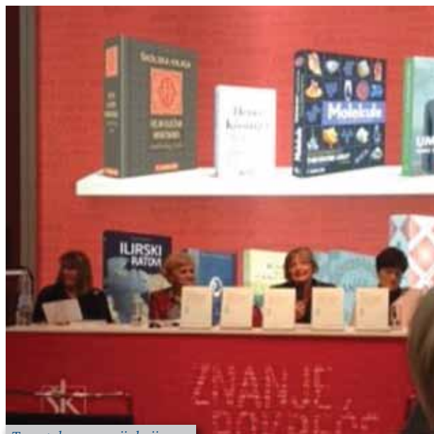
Trenutak s promocije knjige

šta u Zagrebu te Školske knjige, d.d. održana je promocija knjige „Osnove edukacijskog uključivanja. Škola po mjeri svakog djeteta je moguća“. Glavna autorica i urednica knjige je alumna prof. dr. sc. Ljiljane Igrić.