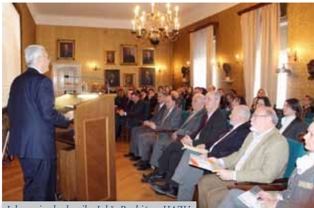
Izlaganje akademika Jakše Barbića u HAZU

Kako je istaknuo akademik Jakša Barbić, potpredsjednik HAZU i predsjednik Znanstvenoga vijeća, zbog razvoja tehnologija, riječ je o izuzetno živom području koje neprestano treba nadograđivati i čije je uređenje u velikoj mjeri ovisno o međunarodnim okvirima. U raspravi je upozoreno da su se nakon ulaska Hrvatske u Europsku uniju mnoge stvari u području intelektualnoga vlasništva promijenile jer je Hrvatska postala potpuno izložena svim europskim mehanizmima zaštite prava intelektualnoga vlasništva koji stručnoj, znanstvenoj i široj javnosti, pa ni samim stvarateljima inovativnih i kreativnih tvorevina, nisu u dovoljnoj mjeri poznati.