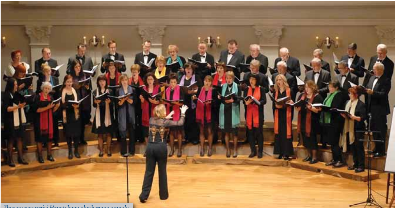
Zbor na pozornici Hrvatskoga glazbenoga zavoda

Sveučilišta u Zagrebu, matičnog Fakulteta kemijskog inženjerstva i tehnologije, predstavnici sponzora i donatora zbora, te Hrvatskog sabora kulture i Ureda za kulturu Grada Zagreba.