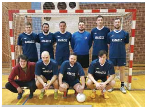
Nogometaši AMACIZ-a, pobjednici turnira