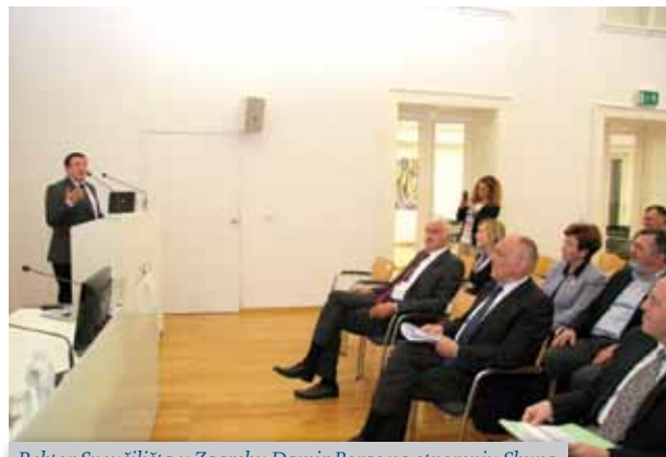
Rektor Sveučilišta u Zagrebu Damir Boras na otvorenju Skupa

Stručni skup Inovacije u medicini IV održana je u srijedu 18. svibnja u Knjižnici HAZU. Skup je otvorio predsjednik HAZU akademik Zvonko Kusić koji je istaknuo da inovacije upravo u medicini doživljavaju brzu primjenu, budući da je suvremena medicina nezamisliva bez suvremene tehnike. Podsjetio je i na nekadašnjega predsjednika Akademije Gustava Janečeka koji je osim utemeljenja moderne hrvatske kemije osnovao i farmaceutsku tvrtku Kaštel (današnja Pliva) i time utemeljio i hrvatsku farmaceutsku industriju, a spomenuo je i hrvatske nobelovce Lavoslava Ružičku i Vladimira Preloga koji su svoja znanstvena otkrića uspjeli direktno povezati s gospodarstvom – Ružička s industrijom parfema, a Prelog s proizvodnjom lijekova. Tribinu je pozdravio i rektor Sveučilišta u Zagrebu prof. dr. sc. Damir Boras koji je istaknuo važnost interdisciplinarnosti za budućnost Sveučilišta. Skup je moderirao prof. dr. sc. Miljenko Šimpraga, prorektor za inovacije, transfer tehnologije i komunikacije Sveučilišta u Zagrebu.