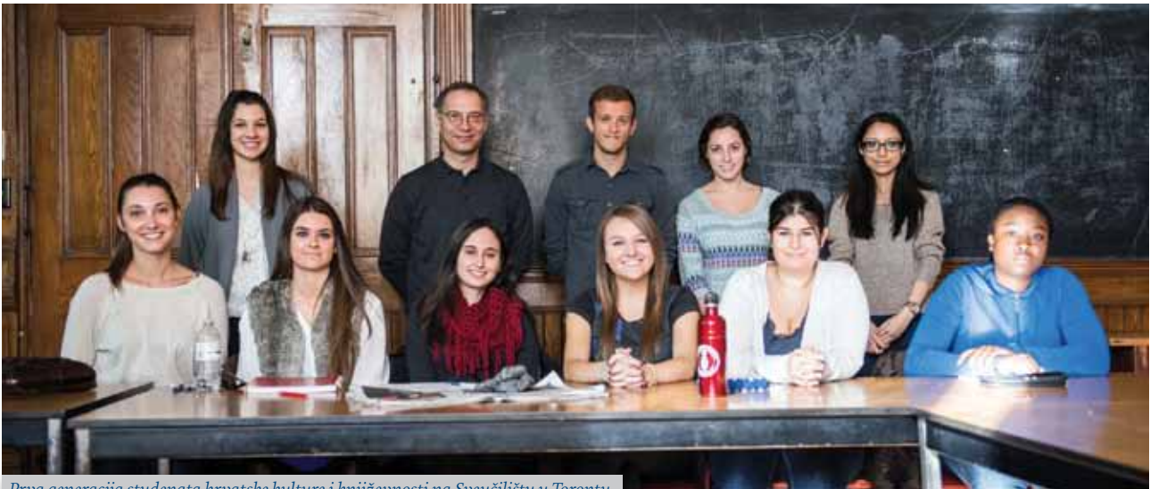
Prva generacija studenata hrvatske kulture i književnosti na Sveučilištu u Torontu

u sklopu predmeta Hrvatski mediteranski gradovi stavljen je naglasak na Hrvatsku književnost, a kako se taj predmet predaje na prvoj, a Književnost na drugoj godini, dio je studenata po inerciji nastavio sljedeće godine slušati i Hrvatsku književnost kao zaseban predmet. Isto tako dogovoren je i viši limit studenata koji mogu pohađati predmet Hrvatski mediteranski gradovi pa je novi limit bio osamdeset studenata.