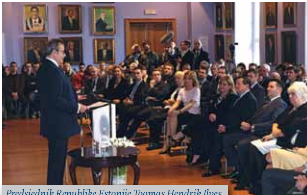
Predsjednik Republike Estonije Toomas Hendrik Ilves

Predsjednik Republike Estonije Nj. E. Toomas Hendrik Ilves održao je u utorak 22. ožujka 2016. u 15.15 sati u auli Rektorata Sveučilišta u Zagrebu predavanje pod nazivom Europe at crossroads, the way forward . Predavanje je ponajprije bilo namijenjeno predstavnicima diplomatskoga zbora, akademskoj zajednici i studentima.