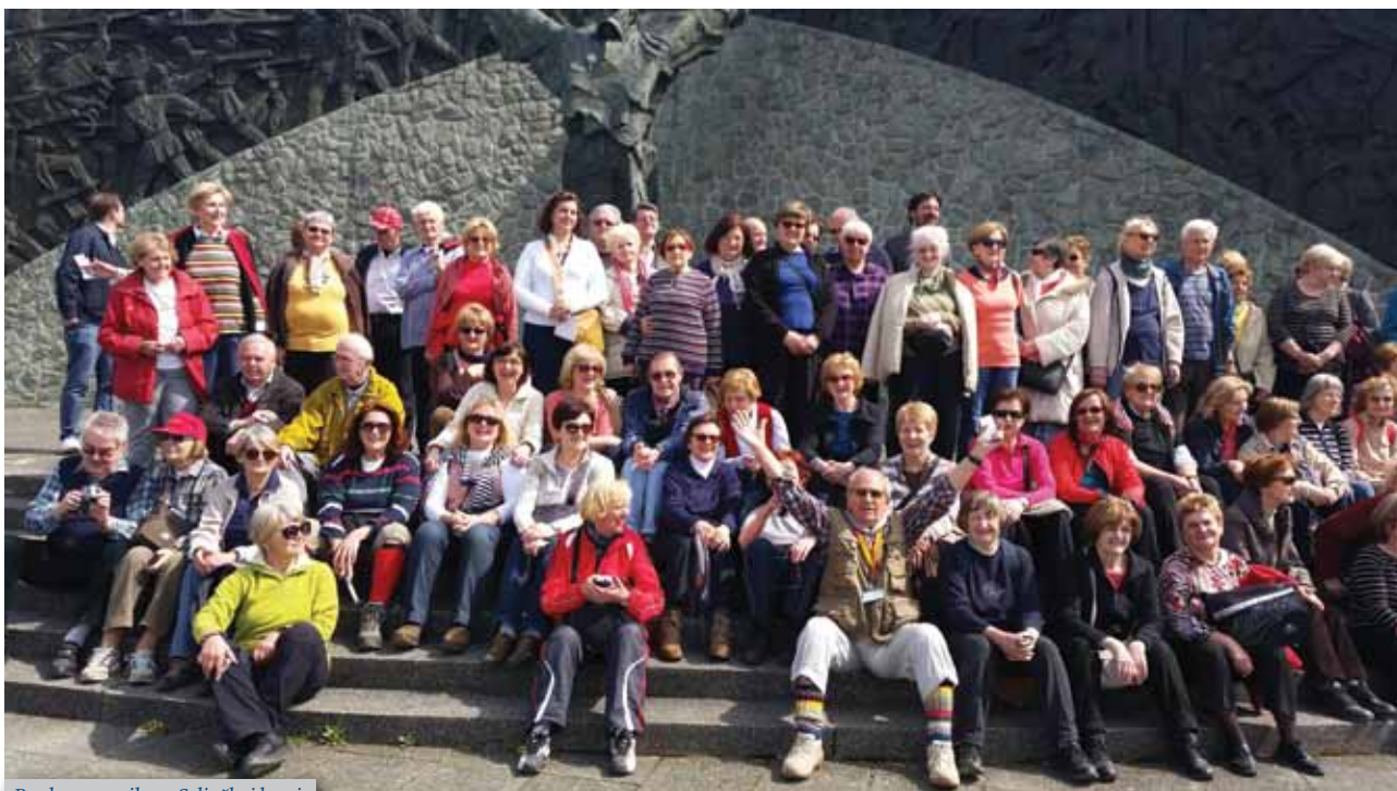
Pred spomenikom Seljačkoj buni

Planinarsko-izletnička sekcija je, kao i obično, vrlo aktivna.