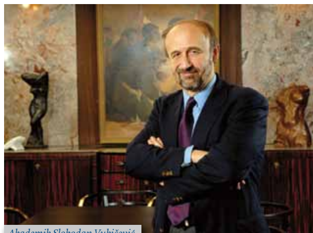
Akademik Slobodan Vukičević

ljuju putem otvorenoga nadmetanja u kategorijama novih i iskusnih istraživača koji rade ili započnu raditi u Europi. Jedini je kriterij za dodjelu projekata znanstvena izvrsnost. Stoga je cilj prepoznati najkvalitetnije ideje i omogućiti vidljivost najbolje europske znanosti te ujedno privući istraživače iz cijeloga svijeta. Dugoročni je cilj uspostaviti jak i samoodrživ europski istraživački sustav te osnažiti akademske institucije kako bi mogle djelovati ravnopravno s vodećim svjetskim istraživačkim centrima.