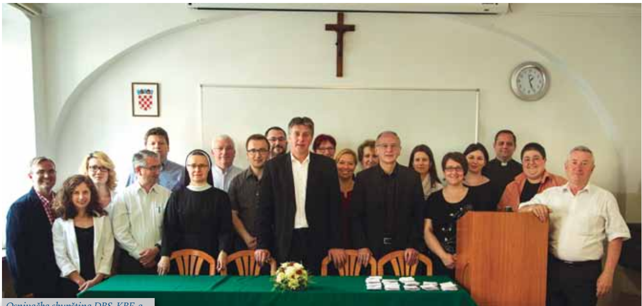
Osnivačka skupština DBS-KBF-a