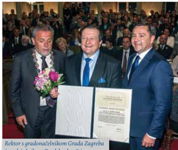
Rektor s gradonačelnikom Grada Zagreba i predsjednikom Gradske skupštine